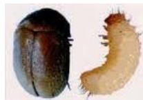
タバコシバンムシ (全態)