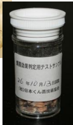
コクゾウムシ (全態)