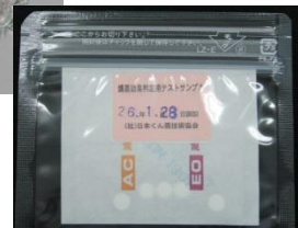
クロコウジカビ (ペーパーディスク5個)